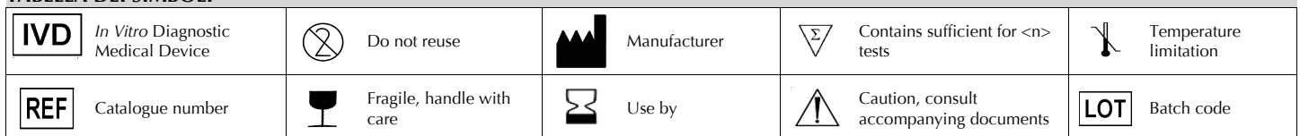
TABELLA DEI SIMBOLI

Una fiala serve per preparare 500 ml di terreno.